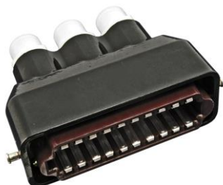
Розетка кабельная РШАГКП20-3