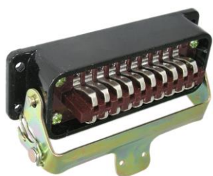
Вилка приборная РШАВПБ20-0